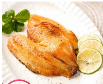
新奥尔良风味鱼排